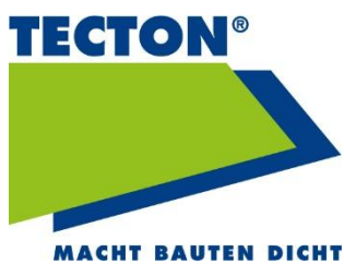
Tecton AG www.tecton.ch